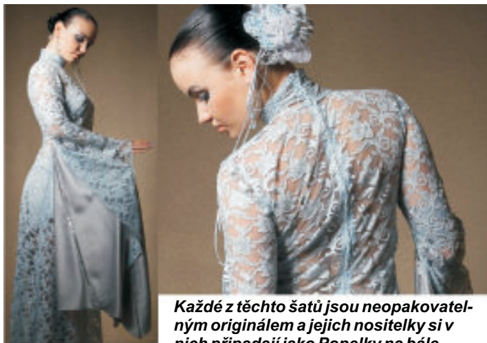
Každé z těchto šatů jsou neopakovatelným originálem a jejich nositelky si v nich připadají jako Popelky na bále.