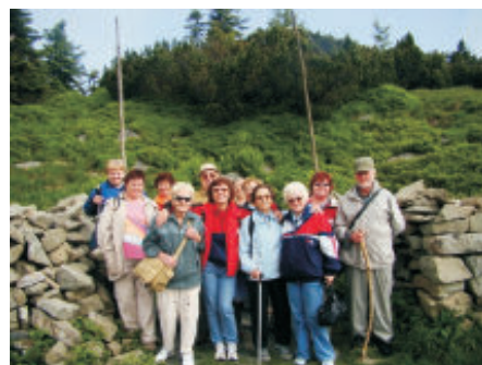
Z výletu na Lysou horu

zde vernisáže. Účast v klubu je bezplatná. Na některé vzdělávací a společenské akce je vstupné dobrovolné. Mezi zajímavé aktivity patří kurz výtvarných technik pod vedením malíře Josefa Odrásky.